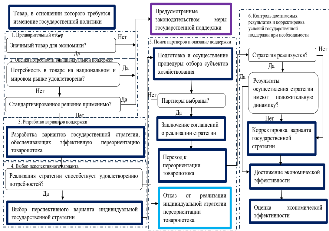
Рисунок 2 – Модель государственного регулирования переориентации товарооборота

Что же касается стимулирования экспорта, то здесь условия схожи – соотношение стоимости продукции на внутреннем и внешнем рынке, а также возможность организации производства или наращивания производственной мощности отдельных видов продукции, востребованной на мировом рынке [5].