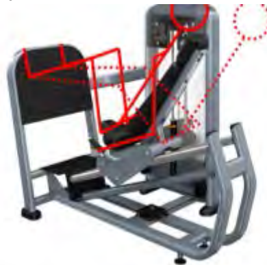
Рисунок 1 – Пример изменения позы во время выполнения упражнения

Пример исследования изменения позы при выполнении силового упражнения приведен на рисунке 1