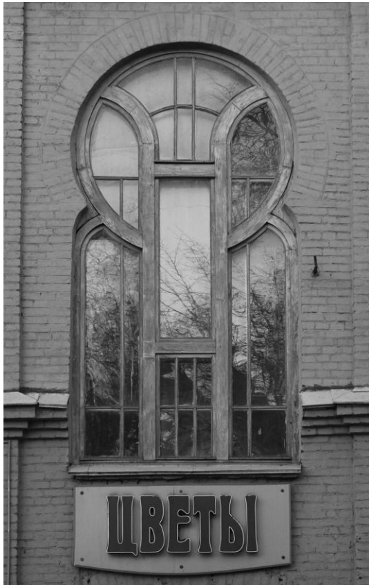
Рис. 4. Окно в стиле модерн. Киселева, 28.

2. Рисунок оконных рам и импостов. В основном встречаются прямоугольные формы переплетов, но есть исключения (сложнооформленное окно дома на Киселева, 28). Двух- или трехчастное деление оконного полотна по вертикали, реже деление на большее количество фрагментов (например, в мансардных шестичастных окнах дома на Киселева, 37). Характерно устройство форточек под фрамугой, отделение нижней части остекления. Фрамуга может делиться импостами на меньшие прямоугольные части (прямоугольная фрамуга, Киселева, 24), либо на сектора в форме лучей солнца (полуциркулярная фрамуга, К.Маркса, 35). Распространен темный цвет переплетов, иногда неокрашенных (просп. Независимости, 77) придающий окну особую визуальную графичность.