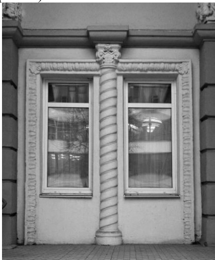
Рис. 7. Красноармейская, 34. Фрагмент главного фасада.

Как предмет исследования практически все обрамления и виды архитектурного декора, «притянутого» окнами и дверями, на фасадах исторических зданий центра города Минска являются аутентичными и достоверно иллюстрируют не только архитектурно-художественные особенности, но и материально-технический уровень и технологические приемы выполнения архитектурных деталей соответствующих периодов (рис. 7).