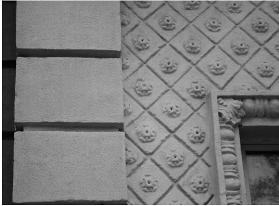
Рис. 6. Красноармейская, 34. Фрагмент декора обрамления проема.

15. Имитация ложных дверных или оконных проемов с помощью порталного обрамления, имеющего обычно достаточно развитую структуру (например, ложный входной портал здания по адресу Красноармейская, 28). В последние годы внутренний простенок такого (или обычного заложенного) проема иногда декорируют уличные художники.