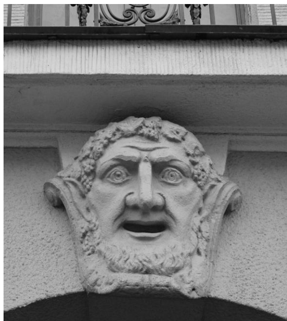
Рис. 5. Ленина, 13. Маскарон на замке арки ворот.

11. Замковые элементы. Являются одной из наиболее выразительных деталей обрамления. Присутствуют в основном вариации классического плоского замкового камня (Киселева, 39), центр надоконного руста, выступающие элементы в виде листа аканта (Независимости, 67). Встречаются маскароны (рис. 5).