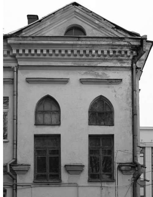
Рис. 1. Здание 1897 г. Энгельса, 18. Окна на дворовом фасаде.

Надо отдать должное центральным улицам, где можно увидеть наибольшее количество оригинальных заполнений. Например, деревянные оконные рамы, датируемые приблизительно 1897 г. на фасаде здания по ул.Энгельса, 18 (рис. 1).