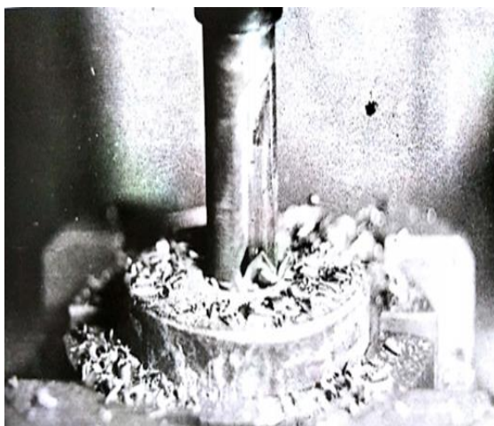
Рис. 2. Сверления отверстий при сверлении с МНП

Сверление отверстий при сверлении с многогранными неперетачиваемые пластинами в сталях 12Х18Н10Т и стали 45 показано на рис. 2.