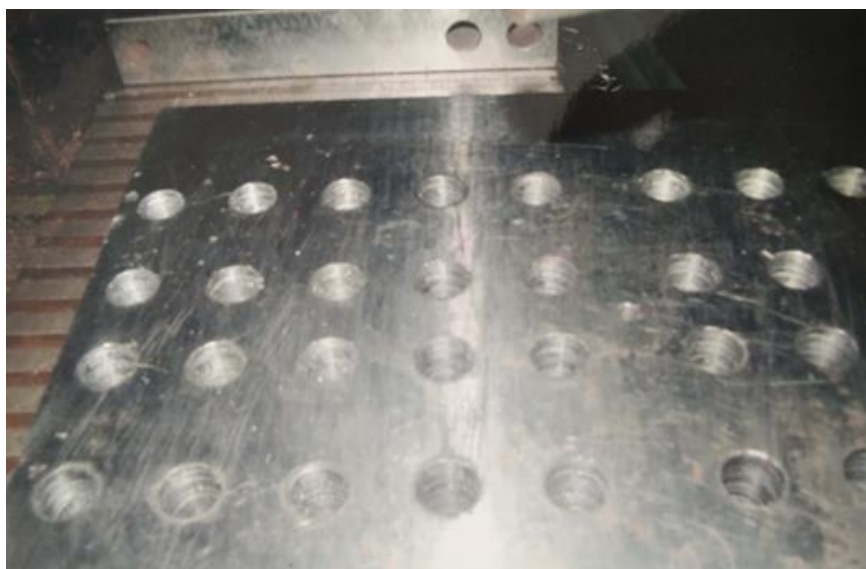
Рис. 3. Наружный вид заготовки из стали 45 на станке модели 6М13В после сверления

На рис. 3. показано наружный вид заготовки из стали 45 на станке модели 6М82Г после сверления.