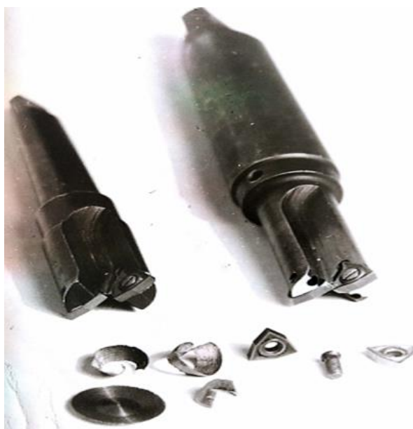
Рис. 1. Общий вид безперемычных сверл с МНП Ø 25 мм

Эффективность применения сверл с МНП обусловлена прежде всего жесткой технологической наладкой станков с ЧПУ и специальной конструкцией режущей части инструмента. Во всех имеющихся конструкциях сверл с МНП режущей пластины расположены таким образом, чтобы отсутствовала поперечная режущая кромка, которая у спиральных сверл приводит к значительному повышению осевой силы в два раза повышает динамическую устойчивость сверл с МНП и соответственно обрабатывать отверстия с точности в пределах 10...12 квалитетов, не смотря на то, что инструмент не имеет центрирующих элементов, таких как у спирального сверла [3].