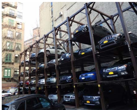
Рис. 6. Нью-Йорк. Вертикальная парковка для автомобилей [10]

Современные технологии позволяют внедрять в городскую среду специальные вертикальные паркинги. Вертикальная парковка увеличивает вместимость парковки в несколько раз по сравнению с традиционной горизонтальной. Частое использование многоуровневых парковочных сооружений в условиях современного развития города объясняется рядом преимуществ, которые включают эффективное использование ограниченного пространства, уменьшение заторов и загрязнения воздуха (снижение выбросов углерода из-за отсутствия необходимости в поездках в поисках парковочного места), повышение безопасности и комфорта для водителей (видеонаблюдение и контроль доступа), возможность интеграции с другими видами транспорта, а также повышение стоимости недвижимости в близлежащих районах. К еще одному из преимуществ многоуровневых парковок относится удобство из-за возможности расположения их в местах для быстрого доступа водителей как на работу, так и на производство. В настоящее время в связи с развитием технического прогресса и инновационных технологий минимальное занимаемое пространство с максимальным количественным размещением автомобилей принадлежат вертикальным автоматизированным системам, оснащенным системой SMART, что делает парковку и извлечение автомобилей быстрым и удобным процессом. Кроме того, такие системы обеспечивают повышенную безопасность по сравнению с традиционными парковками, поскольку они ограничивают доступ к автомобилям и защищают их от кражи и вандализма (рис. 6).