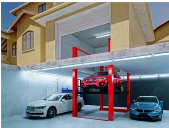
Рис. 4. Пример проекта подземного паркинга [7]

Одной из крупнейших парковок в Германии вместимостью более 2000 автомобилей является Штутгарт-21 в Штутгарте. Сооружение было возведено в рамках проекта реконструкции железнодорожного вокзала города. Парковка отличается рядом особенностей планировочного решения. Многоуровневая конструкция имеет девять подземных уровней, что позволяет разместить большое количество автомобилей на ограниченной площади. Доступ к различным уровням осуществляется по спиральным пандусам, обеспечивающим плавный и эффективный поток движения. Несмотря на то, что парковка находится под землей, она спроектирована таким образом, чтобы максимально использовать естественное освещение. Большие световые люки и отражающие поверхности создают светлое и просторное пространство (рис. 5). Здесь также продумано оснащение сооружений современной системой вентиляции и контролем качества воздуха для обеспечения комфортной и здоровой среды для пользователей [8].