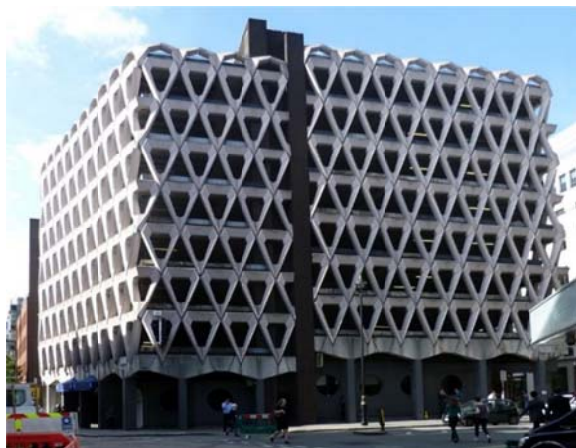
Рис. 8. Автостоянка на Уэлбек-стрит. Лондон. Фотография 2016 г. Архитектор Майкл Блэмпид [12]

Развитие архитектурно-планировочного решения многоуровневых парковочных сооружений не исключает понятие стилистического развития и дизайна. Использование различных материалов и отделки придает многоуровневым парковкам современный и привлекательный внешний вид. Не редким исключением становится то, что именно промышленная архитектура становится ярким образцом стиля . В стиле брутализма в 1970 г. была построена автостоянка на Уэлбек-стрит в Мэрилебоне, Лондон (рис. 8).