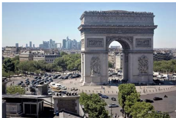
Рис. 3. Площадь Шарля де Голля в Париже [6]

Интеграция парковки Этуаль состоит в связи с общественным транспортом. Это и наличие прямого выхода на станцию Charles de Gaulle-Étoile , которая обслуживает несколько линий метро.