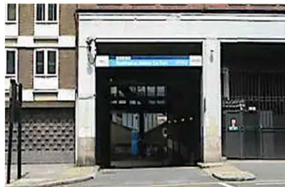
Рис. 2. Paddington Central в Лондоне, Англия [4]

Современные тенденции организации многоуровневых парковочных сооружений во Франции становятся все более популярными, являясь неотъемлемой частью городской инфраструктуры, особенно в густонаселенных районах. Эти сооружения отличаются продуманными планировочными решениями, которые обеспечивают удобство, безопасность и эффективность использования. Обычно они проектируются с использованием спиральных пандусов или механизированных систем парковки для максимального использования пространства. Безопасное, комфортное движение обеспечивают ясные указатели, информационные табло, пожарная сигнализация, широкие проезды и хорошо освещенные уровни. Сотрудники службы