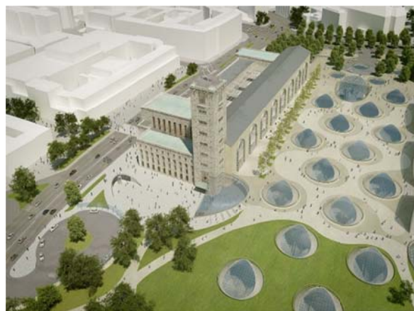
Рис. 5. Проект реконструкции железнодорожного вокзала в Штутгарте со световыми люками подземной парковки [8]

собствует ее соединению с близлежащими районами и достопримечательностями. Эстетическую привлекательность парковке придают высаженные вокруг нее зеленые насаждения. Таким образом, выполняя свою основную функцию краткосрочного хранения и бронирования парковочного места в режиме реального времени, паркинг не только поддерживает устойчивую городскую мобильность, но и улучшает качество проживания в городской среде со сложной инфраструктурой.