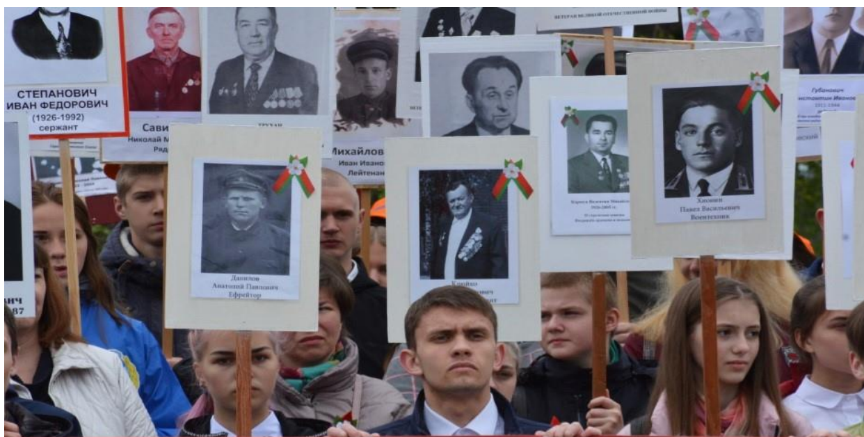
Фото 10. Прадедушка в рядах «Бессмертного полка» (в центре), 2020 г., г. Слуцк

В настоящее время осталось в живых очень мало ветеранов Великой Отечественной войны. Но мы должны помнить об их подвиге и не забывать ужасы той страшной войны.