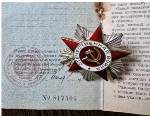
Фото 5. Орден Отечественной войны II степени