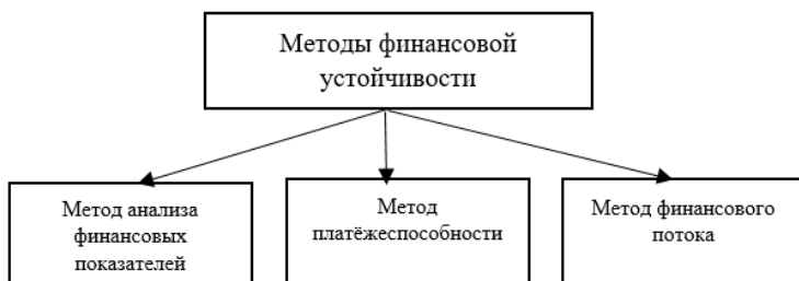
Рисунок 15 – Методы финансовой устойчивости

Для более обширного понятия о методах финансовой устойчивости, рассмотрим каждый метод более детально: