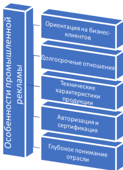
Рисунок 2 – Особенности промышленной рекламы

Промышленная реклама имеет ряд особенностей, которые представлены на рисунке 2.