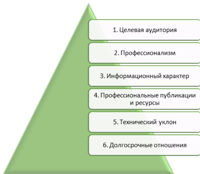
Рисунок 1 – Аспекты промышленной рекламы

Немаловажным аспектом промышленной рекламы является четкая информация о продукте или услуге, которая будет полезной и сыграет ключевую роль в принятии решения о покупке.