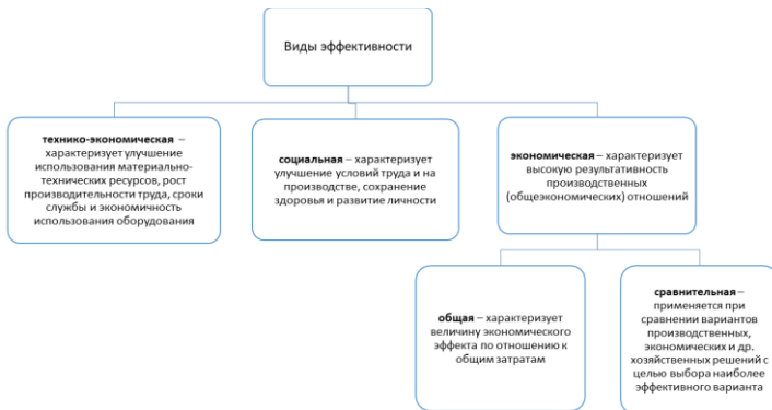
Рисунок 2 – Виды эффективности

Виды эффективности представлены на рисунке 2 [5].