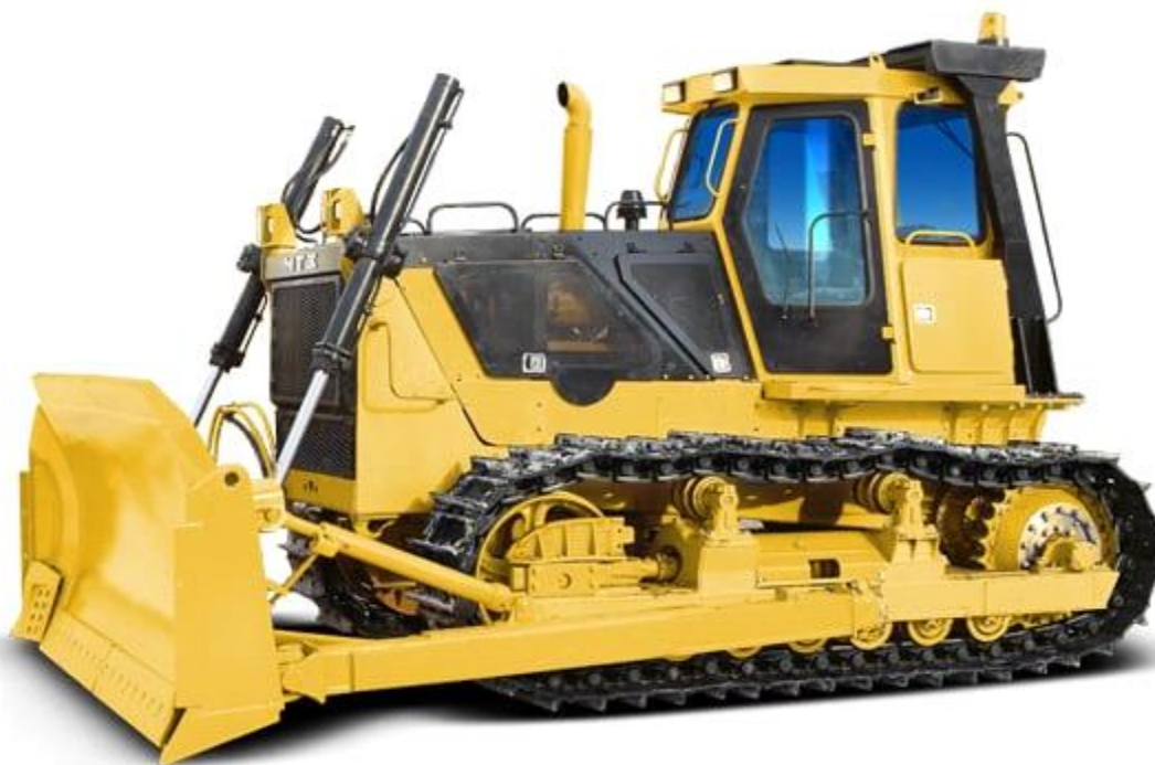
Рисунок 1 – Бульдозер

Главная задача – с помощью данной научной работы кратко и ясно передать информацию об этой технике.