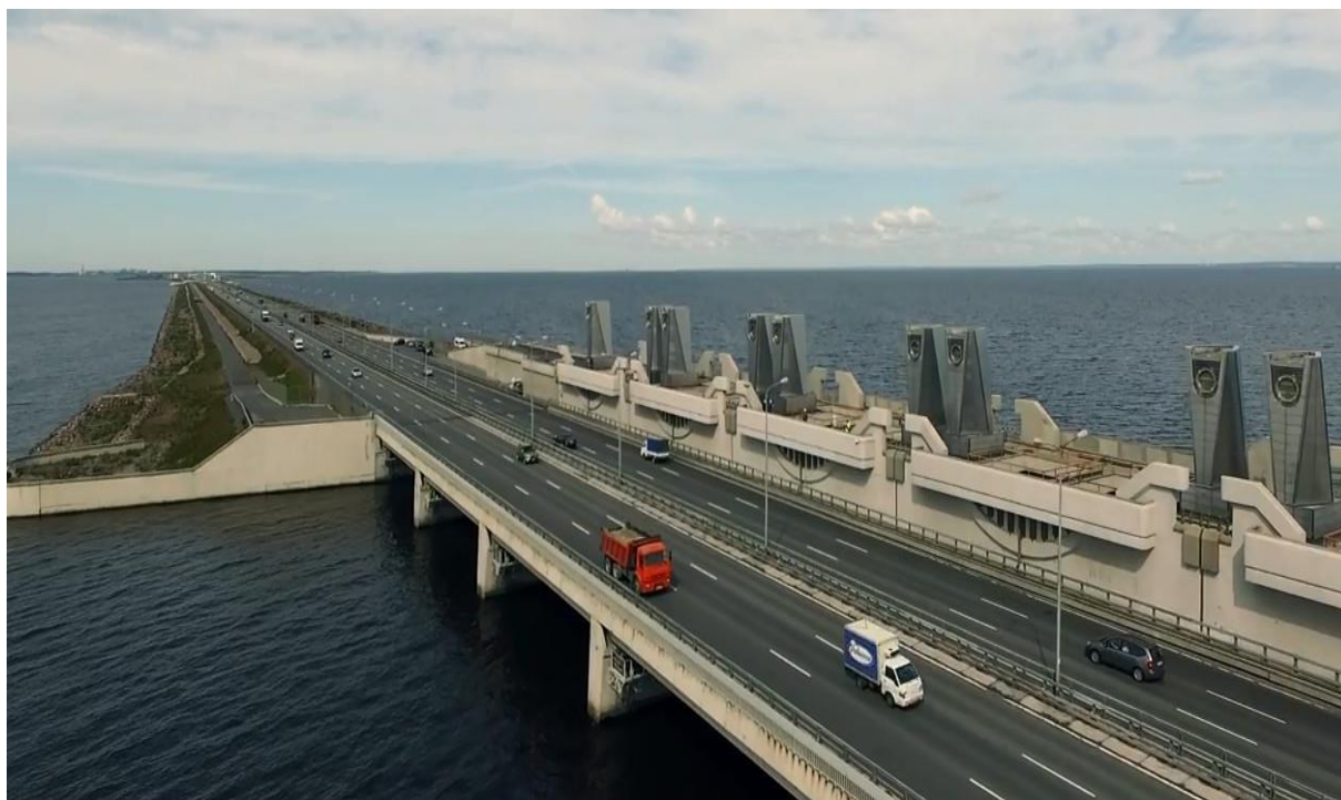
Рисунок 1 – Защитная дамба Санкт-Петербурга

Основная задача дамбы – это защита города от множества наводнений, которые не так редко там случаются.