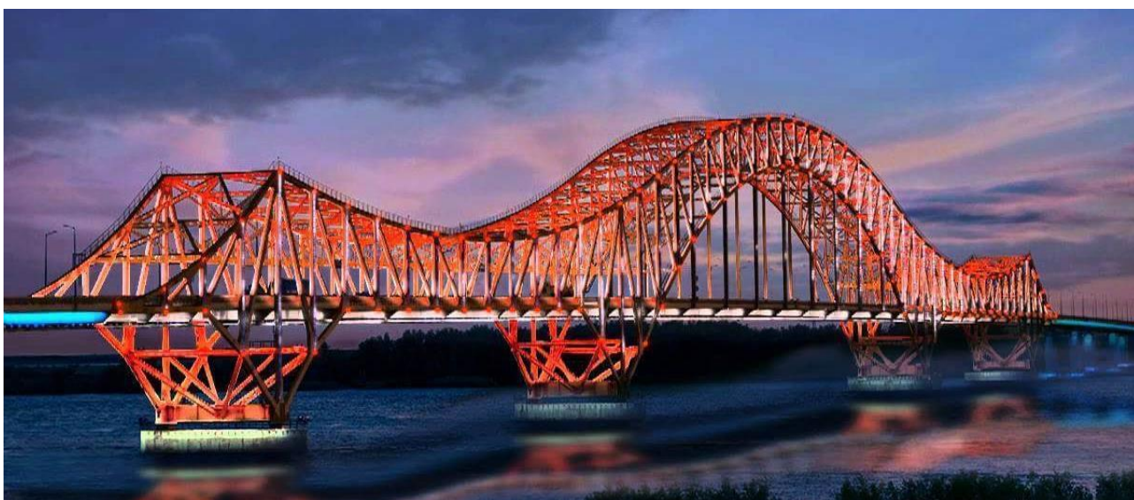
Рисунок 1 – Мост «Красный дракон»

Мост через реку Иртыш также известный как мост «Красный дракон» был сдан в эксплуатацию 20 сентября 2004 г. Компания ОАО «Трансмост» выступала проектировщиком. Мост «красный дракон» был прозван так из-за конструкции моста, можно заметить, что он и правду похож на выгнувшего спину дракона, так же мост был покрашен в огненный цвет и в ночное время это особенно заметно (Рис. 1).