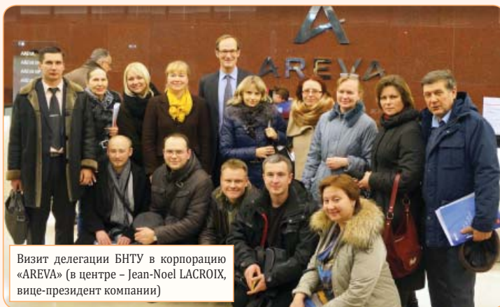
Визит делегации БНТУ в корпорацию «AREVA» (в центре – Jean-Noel LACROIX, вице-президент компании)

первого контура воспроизведены в масштабе 1:1 (без ядерного топлива). В этом уникальном центре собрано современное оборудование, используемое в первом контуре атомных электростанций, а также оборудованы учебные стенды для отработки навыков обслуживания основных элементов конструкций и компонентов оборудования. На базе объекта прошли встречи со специалистами, изучена специфика эксплуатации и функционирования основных элементов.