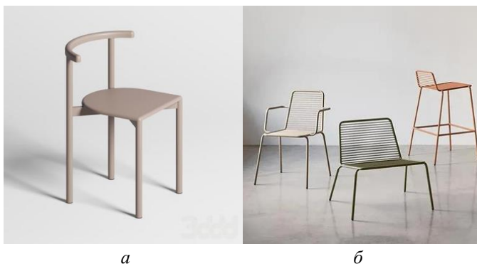
а б Рисунок 3 – Примеры мебели DELO:

Современные требования к предметному дизайну продолжают включать функциональность и целесообразность, а дизайн сохраняет интерес к конструктивистской эстетике. Проекты стандартной мебели для общественных помещений 20-х – 30-х гг. XX в. имели лаконичный внешний вид, угловатость, строгость, монолитность. Подобный характер нашёл своё воплощение в дизайне стульев петербургского бренда DELO, основанного архитектором Арсением Бродачем в 2014 г. Дизайн-код бренда опирается на советский конструктивизм: мебель соответствует принципам рациональности и функциональности, а дизайн характеризуется чистыми линиями и простыми геометрическими формами. Цветовая палитра коллекций ограничена и включает нейтральные оттенки (рис. 3).