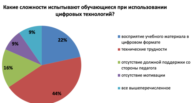
Рисунок 2 – Сложности, которые обучающиеся испытывают при использовании цифровых технологий

Необходимо учитывать сложности, которые испытывают и обучающиеся при использовании цифровых технологий. Анализ анкетирования выявил, что 44 % детей испытывают технические трудности, 22 % обучающихся испытывают сложности в восприятии учебного материала в цифровом формате (рис. 2) [4].