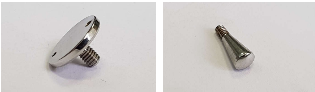
Рис. 3 – Образцы изделий из коррозионностойкой стали после полирования с применением управляемых импульсных режимов электролитно-плазменной обработки

Примеры изделий из коррозионностойкой стали после полирования с применением управляемых импульсных режимов электролитно-плазменной обработки представлены на рис. 3.