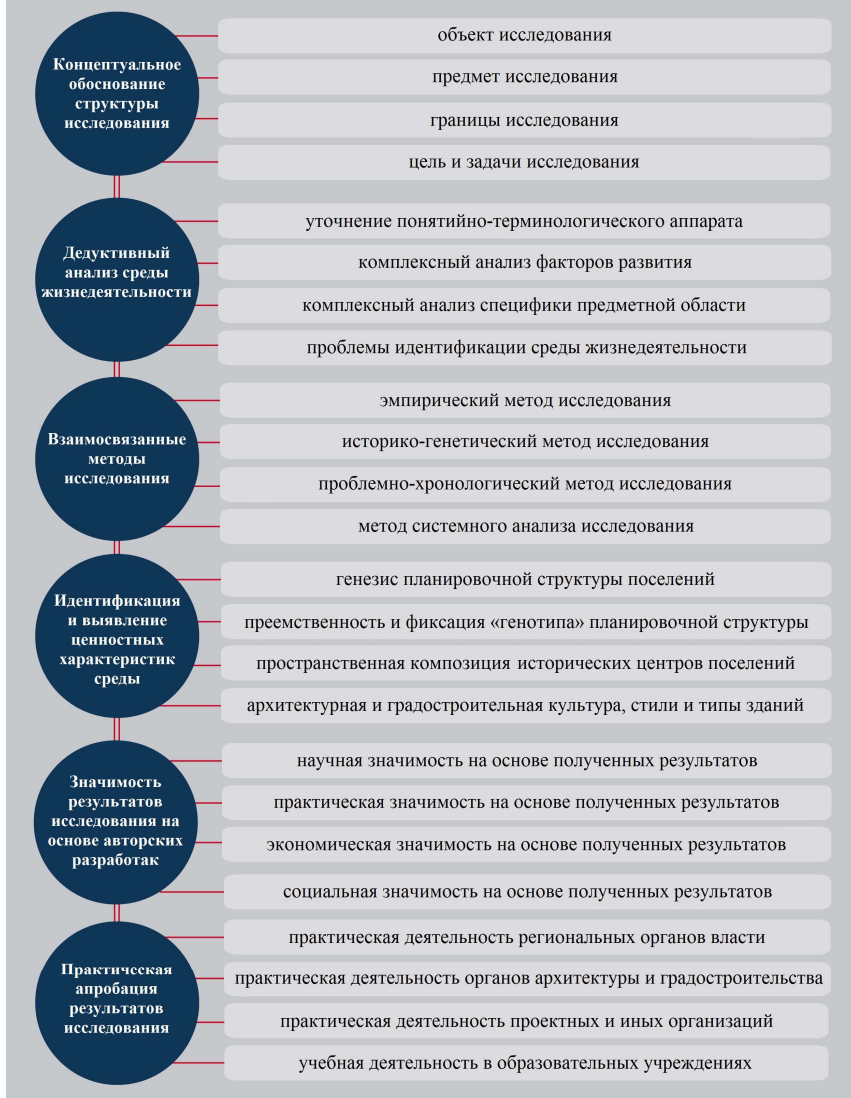
Рисунок 1 – Логико-структурная модель исследования