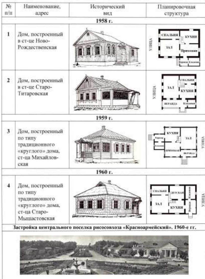
Таблица 1 – Жилые дома, построенные на Кубани. Вторая половина XX в. Застройка центрального поселка рисовхоза «Красноармейский». 1960-е гг.