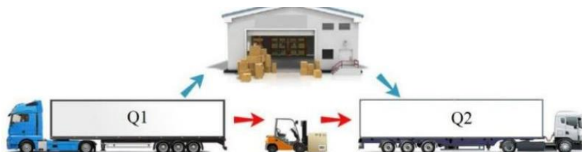
Рисунок 2 – Схема перевалки грузов напрямую или через СВХ

Схема с перегрузкой имеет свои преимущества: нет необходимости арендовать «чужой» прицеп (полуприцеп) и нести риски, связанные с его эксплуатацией.