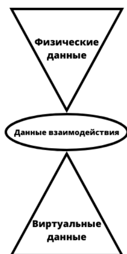
Рисунок 1 – Принцип построения цифровых двойников

Создание цифровых двойников построено на принципах цифровой обработки данных.