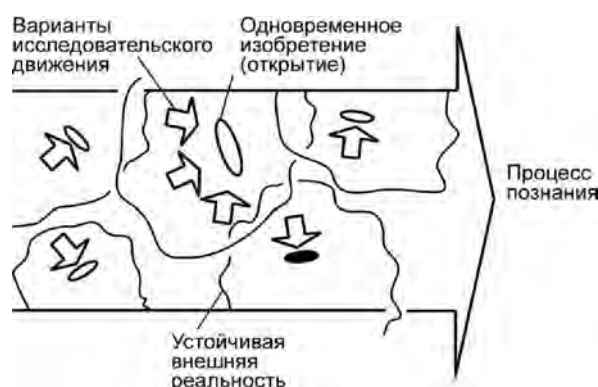
Рис. 2. Создание одновременных изобретений как проявление фактора случайности в научном поиске

С целью исключения патентования одинаковых объектов в патентные системы практически всех развитых стран мира введен критерий новизны технических решений, заявляемых в виде изобретений. Его соблюдение проверяется специально создаваемым национальным институтом экспертов, причем мировая практика проведения экспертных исследований новизны действует более двух столетий. Следует отметить, что значительная часть технических решений, претендующих на патентование, отвергается именно по причине несоответствия этому требованию. Равно так же проверяются на наличие новизны и другие заявляемые объекты промышленной собственности, например, полезные модели, промышленные образцы, товарные знаки.