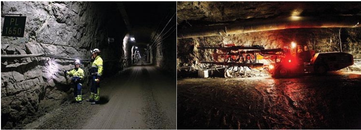
Рисунок 2 – Финский постоянный могильник Онкало

В настоящее время проработана система захоронения с обеспечением нескольких степеней защиты: топливные сборки будут помещаться в герметичный чугунный кожух для предотвращения смещения сборок, чугунный кожух будет помещен в медную капсулу для защиты от коррозии, а между медными капсулами будет залита бентонитовая глина для обеспечения стабильного положения капсул в породе. Через глину может посредством диффузии проникать вода, но процесс настолько медлителен, что на преодоление слоя воде понадобятся миллионы лет.