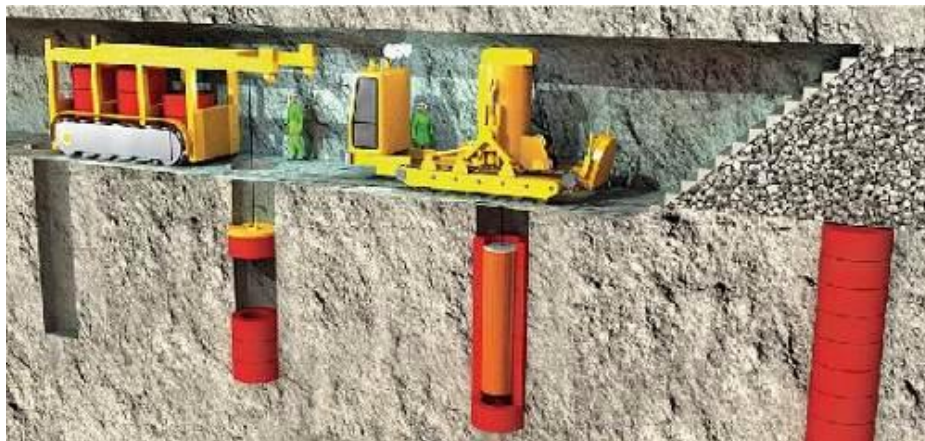
Рисунок 3 – Заполнение хранилища

Затем резервуары пройдут проверку на предмет дефектов и утечек рентгеновским излучением, ультразвуковым анализом и электромагнитными полями. Если тесты не выявят проблем, отработанное топливо будет опущено через шахты непосредственно к месту захоронения (рисунок 3).