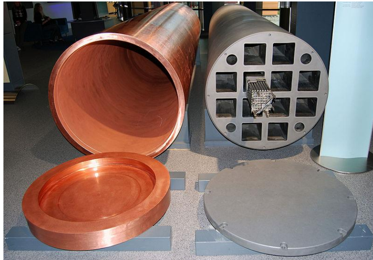
Рисунок 4 – Шведская капсула для захоронения ОЯТ

В настоящее время около города Остхеммар, в гранитных породах на уровне 450 метров под землей создана исследовательская лаборатория, где контейнера для ОЯТ проходят натурные испытания (рисунок 4).