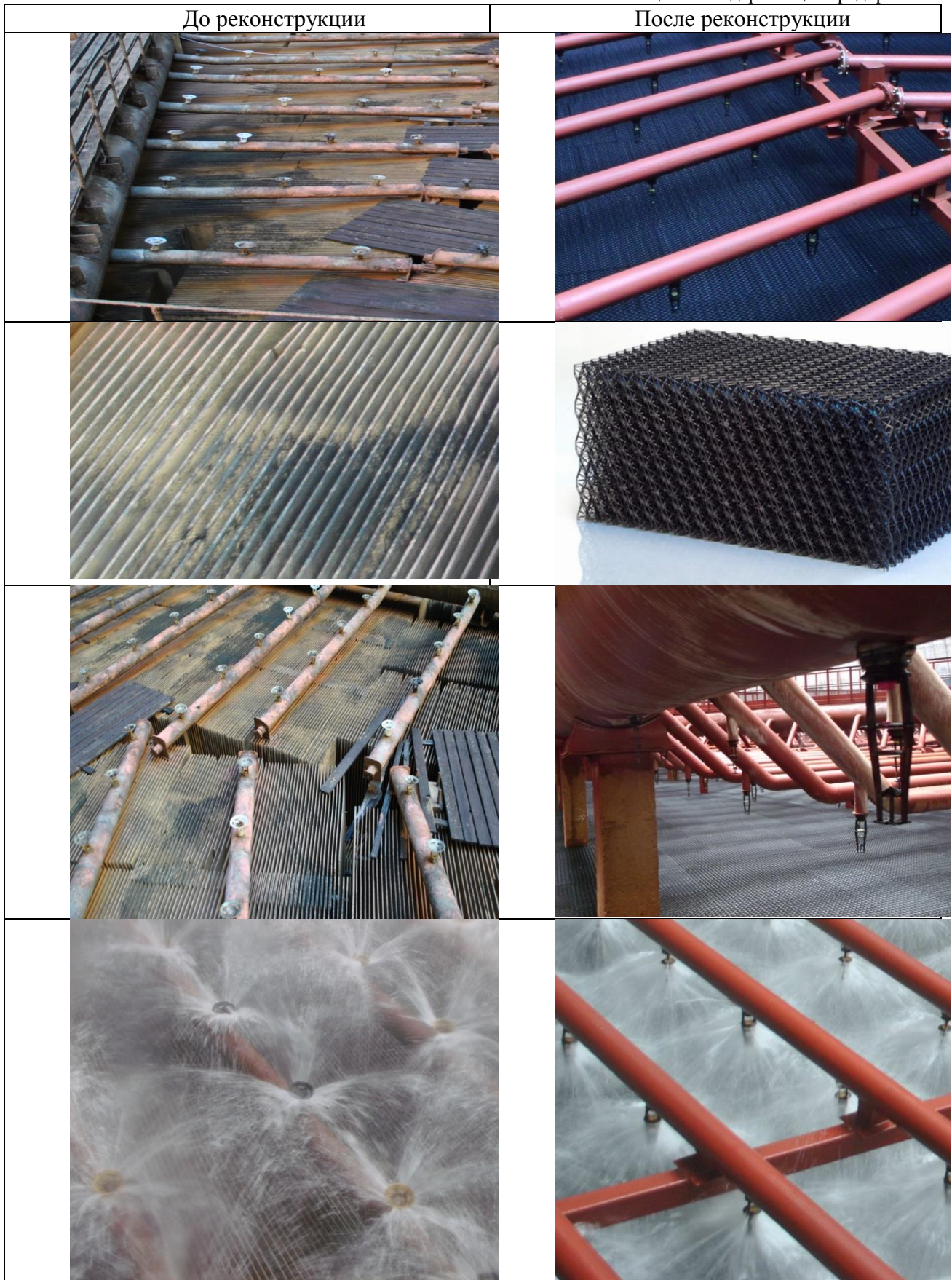
Таблица 1 – Модернизация градирни №1