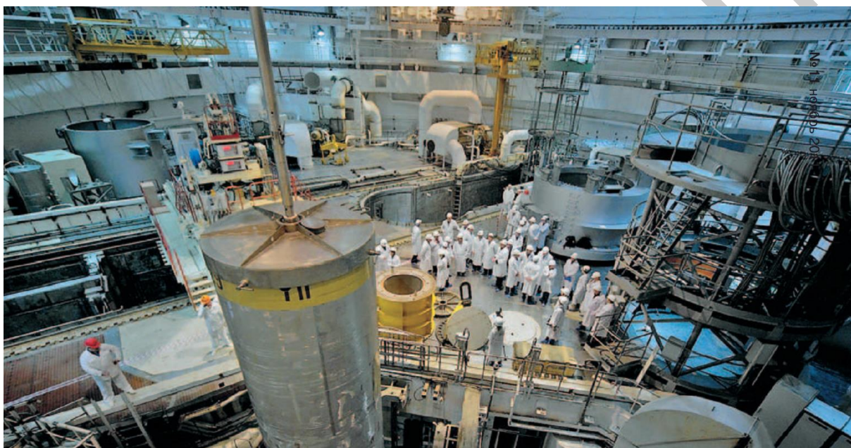
Рисунок 1 – Физический пуск блока № 4 ВВЭР-1000 Калининской АЭС в 2011 г.

Атомные электростанции – филиалы ОАО «Концерн Росэнергоатом», являясь современными предприятиями динамично развивающейся ядерной энергетики России, имеют высокий уровень техники и технологии, организации и культуры труда. На многих из них эксплуатируются водо-водяные энергетические реакторы корпусного типа с водой под давлением (ВВЭР), – аналогичные сооружаемым на Белорусской АЭС (рисунок 1) [1].