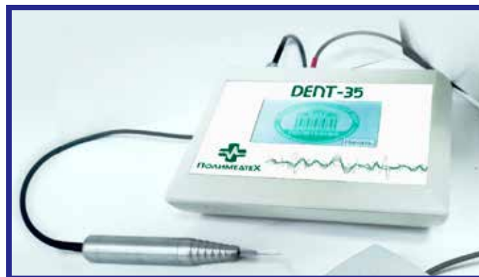
Рис. 3. Стоматологический аппарат DENT-35

В 2016 г. налажено производство изделий для диагностики онкологических заболеваний – автоматического биопсийного пистолета и адаптеров со сменными направляющими, причем последние изготавливаются индивиду-