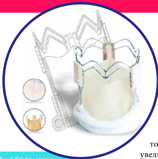
Рис. 1. Клапан сердца

Высокоточная фемтосекундная лазерная установка позволяет изготавливать фильтр-ловушки для улавливания тромбов – устройства, которые свободно пропускают кровь, но создают препятствие для тромбов; баллонорасширяемые и саморасширяющиеся стенты для периферических и коронарных артерий с оригинальной конструкцией, которые обеспечивают необходимую жесткость, устойчивость к излому и полностью соответствуют антропометрическим и физиологическим возможностям человека.