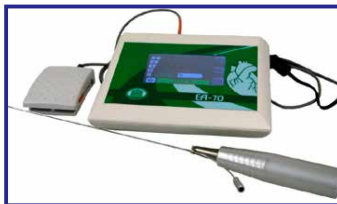
Рис. 4. Акустическая система

дуально под размеры уже имеющегося ультразвукового датчика. Обеспечена их патентная защита и получены регистрационные удостоверения.