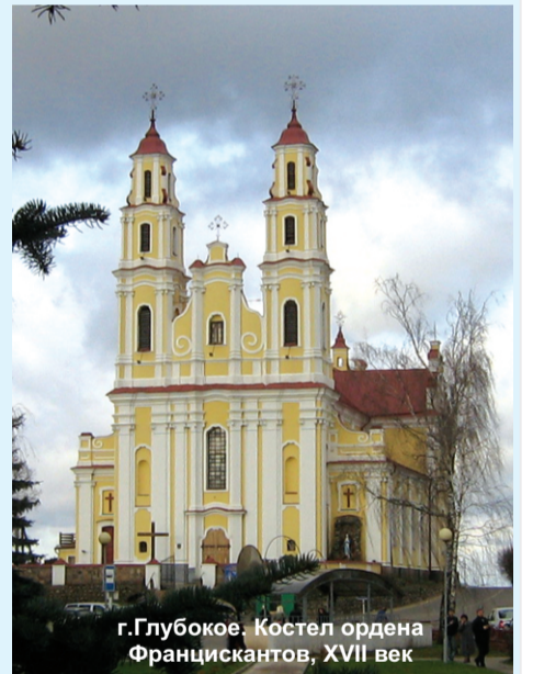
г. Глубокое. Костел ордена Францискантов, XVII век