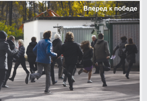
Вперед к победе

стали ученики 10 «Е», а третьими — 10 «В» классов.