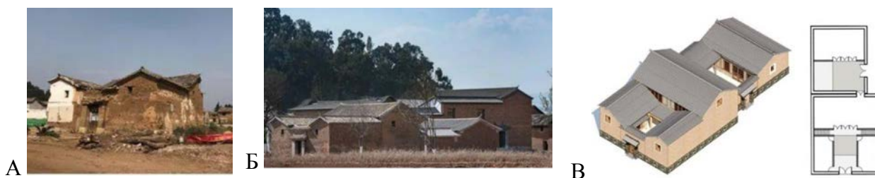
Рис. 2. Реконструкция дома семьи Дэн: А – Вид старого дома, Б – Вид нового дома; В – перспектива и план

С соблюдением принципа защитно-развивающего подхода проектировщики восстановили старые здания, используя методику «старые методы – новые материалы», следуя логике строительства старых зданий и традиционным технологиям строительства, применяя современные методы проектирования. Они максимально выявляли особенности местной архитектуры стиля «одной печати» через «извлечение традиционных элементов, приоритет сохранения, современное преобразование пространства, использование старых и новых материалов». При реконструкции жилого дома семьи Дэн ( Ошибка! Источник ссылки не найден.Ошибка! Источник ссылки не найден. ) был восстановлена оригинальная форма плана «одной печати», с созданием в застройке двора двух отдельных зон. Здание было использовано для размещения общественной библиотеки, использованы даже навесы, под которыми уютно можно организовывать беседы, встречи, отдых. Другие пустующие дома также были отремонтированы и используются как рабочие студии, природные классы, магазины и т. д.