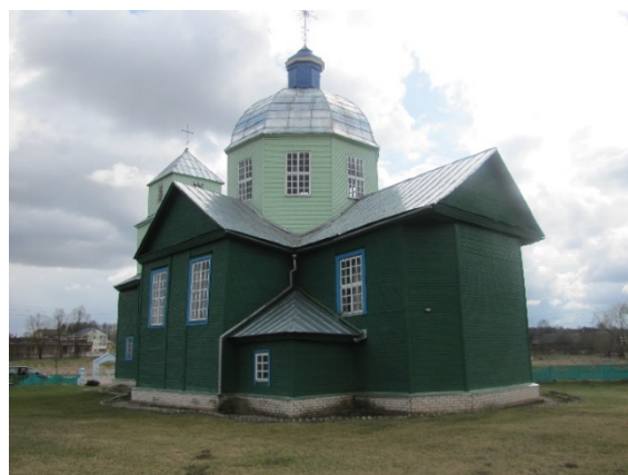
Рис. 3. Спасо-Преображенская церковь в д. Порплище. Фотография автора, 2015 г.

Взаимосвязь деревянной и каменной архитектуры определяется через сравнение стилей, форм и конструкций, которые используются в обоих типах зданий. Например, барокко в деревянной архитектуре проявилось в использовании более сложных форм и декора, фигурных элементов, резьбы, более дорогих материалов, таких как шпонированное дерево. Влияние народного зодчества и местных традиций проявляется в использовании типичных для региона элементов архитектуры, материалов и декора. Профессиональное воздействие архитекторов каменных сооружений на деревянное зодчество отражается в интеграции каменных элементов в деревянных зданиях и применение каменных конструктивных решений в строительстве из дерева.