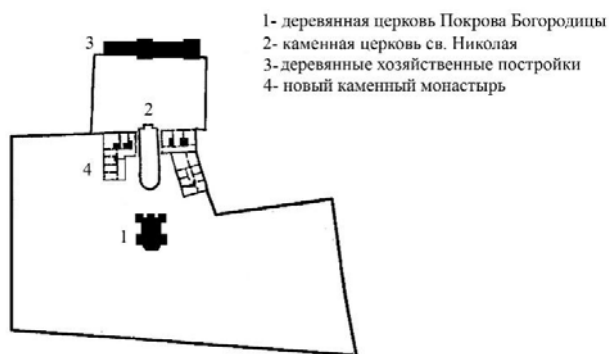
Рис. 2. Схема генплана Онуфрьевского монастыря в Сельце [1, с. 93]

как храм Преображения в Порплище, который был построен в 1627 г. [2, с. 425] и до сих пор остается одним из самых красивых купольных памятников деревянной архитектуры Беларуси (Рис. 3).