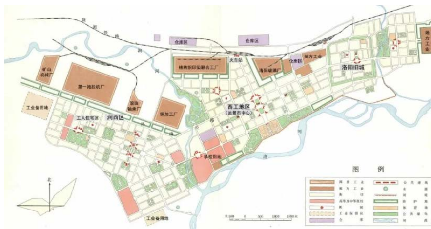
Рис. 1. Первый вариант генерального плана города Лоян (1956 г.)

Во втором издании генерального плана города Лоян ввиду относительно небольшого количества озеленения и наличия обедненных ландшафтов усилено строительство городских парков: строительство Чжоушань - Лесного парка, парка Шаньян в устье реки и парка Хуалинь в устье реки. Планировалось строительство прибрежных ландшафтов и объектов: парка Луопу на северном берегу реки, парка на берегу реки Луохэ и прибрежные зоны по обе стороны канала Чжунчжоу. Для улучшения окружающей среды и ландшафта города был создан «Большой план озеленения окружающей среды» (Рис. 2). В генеральном плане Лояна 1993 г. с точки зрения размещения зеленых насаждений предусмотрена «крестообразная» структура зеленого ландшафта, которая находится в лесопарке Чжоушань, зеленые насаждения и городские парки конфигурируются в соответствии с радиусом обслуживания.