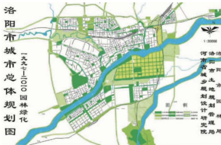
Рис.3. Третье издание генерального плана города Лоян (1993 г.)

В настоящее время структура зеленых насаждений Лояна подразделяется на зеленые зоны, зеленые коридоры и зеленые узлы. Зеленые зоны включают внешний экологический зеленый клин города Лоян и городской парк наследия Суй Танг Лояна (Рис. 4).