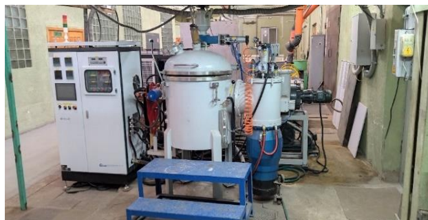
Рисунок 1- Общий вид лабораторной вакуумной индукционной печи

Конечной целью данного литейного процесса является получение слитка комплексного силицида с плотной, однородной, термонапряжённой структурой, который легко поддается последующему процессу дробления и измельчения.