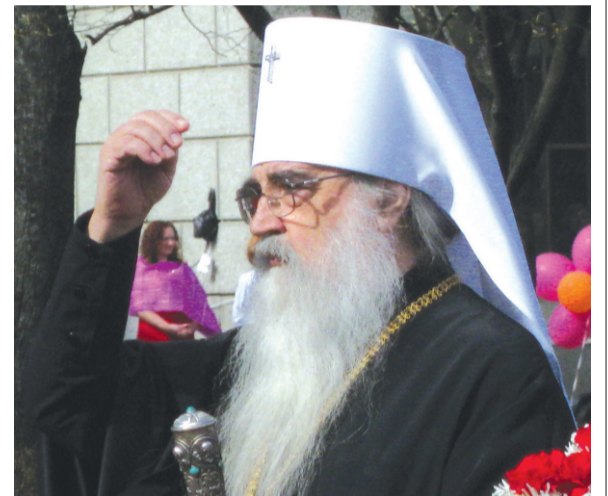
Чин литии по погибшим в годы Великой Отечественной войны преподавателям и студентам

В 2009 году тематическая направленность выставки «Свет учительской любви»: «Настави мя, Господи, на пути спасения», – читаем в православных канонах. При этом мы должны основываться на примере Спасителя и Его апостолов, на мудром наследии святоотеческого учения. Роль учителя – исцелять сердца людские, быть наставником подрастающим поколениям и примером мудрости во всем. Как сказал ученый педагог XVI в. Милетий Смотрицкий: «Большая польза от знаний будет зависеть от вашего усердия, учитель». Сегодня особенно важно сохранить уважение к учителю, веру в его добродетельный труд. Ведь подлинное знание и мудрость связаны, прежде всего, не с информацией и рыночными отношениями, а с верой, надеждой и любовью. Именно поэтому