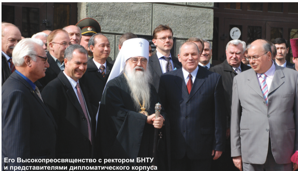
Его Высокопреосвященство с ректором БНТУ и представителями дипломатического корпуса

Наше общество признает христианские ценности – радость жизни, мир, милосердие и сострадание, любовь к жизни и своему Отечеству. Весной, когда природа пробуждается, наша страна наполняется новыми красками, все торжествует в мире, и приходит к нам великий праздник – Пасха. Пасхальная радость объединяет и радует, ведь истинная, духовная любовь доступна всем. Особенно радостно в эти дни встречать друзей в нашем гостеприимном доме – Белорусском национальном техническом университете.