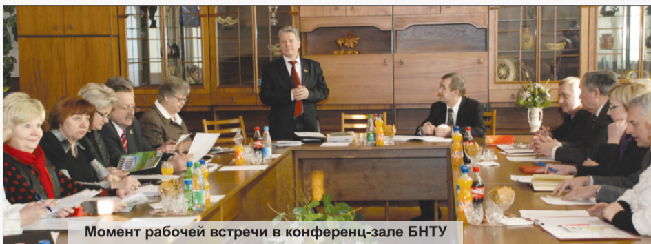
Момент рабочей встречи в конференц-зале БНТУ

Белорусский национальный технический университет по праву считается ведущим техническим вузом страны. Наш университет практически по всем международным стан-