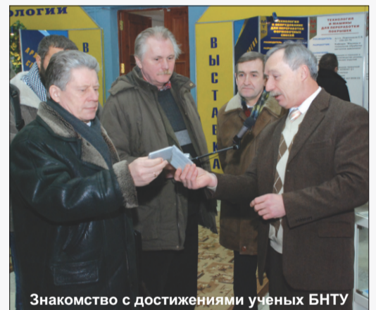
Знакомство с достижениями ученых БНТУ