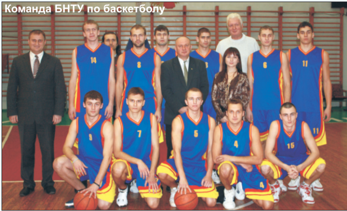
Команда БНТУ по баскетболу