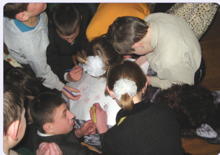
Мы рисуем солнце