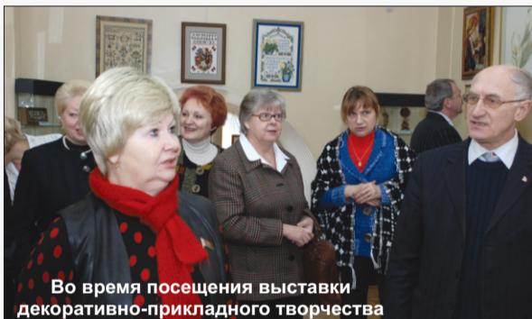
Во время посещения выставки декоративно-прикладного творчества