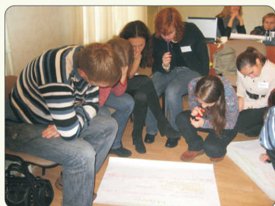
Идет тренинговое занятие

Тренинг «Управление временем» позволил нам найти в своей, казалось бы, насыщенной жизни резерв времени, осознать, куда уходит наше время и где его можно найти. За время наших встреч мы преобразились: стали более дисциплинированы, целеустремленны, более уверены в себе, повысили собственную самооценку и стали больше успевать. Нам стало легче и интереснее учиться.