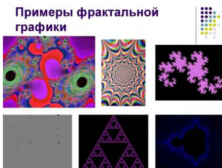
Рисунок 1 – Примеры фрактальной графики

Фракталы имеют также важное значение для компьютерных технологий и графических приложений. Создание и отображение фракталов стало возможным благодаря развитию компьютерной графики и алгоритмов.