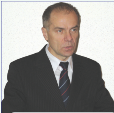
Генеральный прокурор Республики Беларусь, Государственный советник юстиции 1-го класса, доктор юридических наук Григорий Алексеевич Василевич