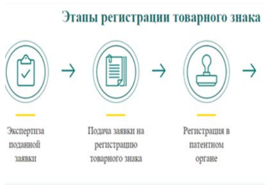
Рисунок 3 – Регистрация товарного знака

Заключение. Логотип – это визитная карточка не только товара и его производителя, но и страны, где товар был изготовлен. Если логотип разработан грамотно, то в нем содержится максимум полезной информации, дающей полное представление о качестве товара, вырабатывая у потребителя доверие к данному товару и обеспечивая стабильный спрос на него.