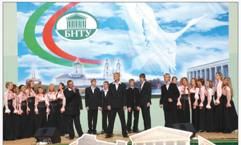
Фрагмент выступления народной хоровой капеллы БНТУ

дия на протяжении истории БПИ-БГПА-БНТУ. Представители всех факультетов возложили цветы к Стеле памяти преподавателей, сотрудников и студентов, отдавших свои жизни за независимость Родины в годы Великой Отечественной войны. Ансамбль