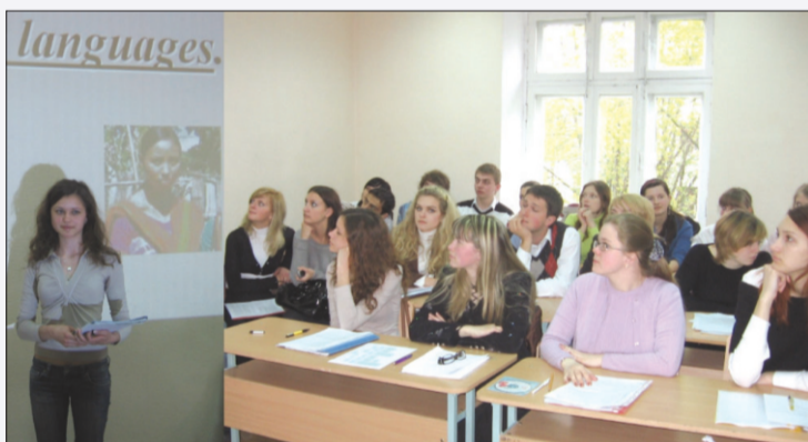
На студенческой научно-технической конференции. Секция "Лингвистика и страноведение"

И третье направление нашей работы — межвузовские олимпиады. Здесь Центр также сыграл свою роль. Во второй и первой олимпиадах участвовали только наши и студенты БГУИР. А в третьей — представители уже 6 вузов Мин-