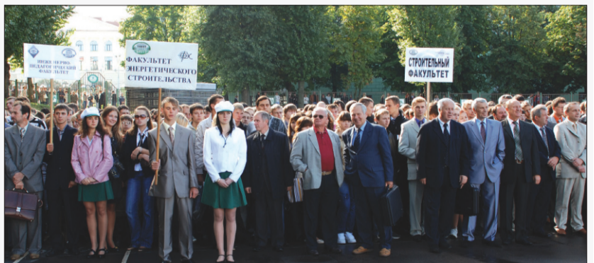
Первокурсники с руководством факультетов