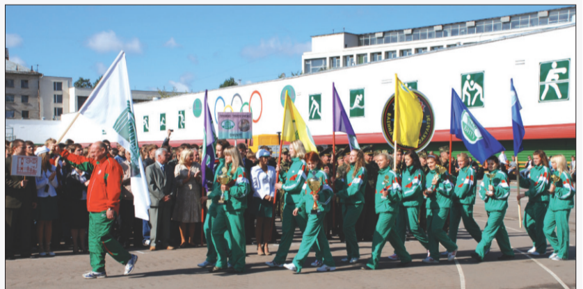
Колонна наших спортсменов

Художественная часть торжественной линейки «Первокурсник БНТУ-2008» была насыщенной и динамичной. Ретро-номер от обладателей Гран-при на празднике танцев фестиваля студенческого творчества «Весна БНТУ-2008» приборостроительного факультета внёс характерную изюминку в общую концепцию