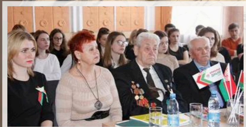
Материал подготовил: Дроздов Владислав Михайлович ВТФ, группа И502122