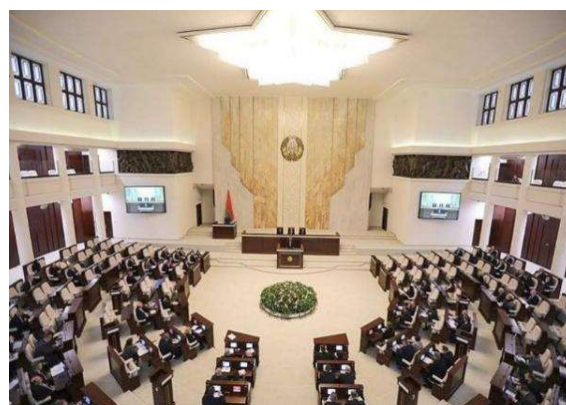
Рис. 7. Рельеф в зале заседаний, Дом Правительства, арх. И. Лагбард, скульпт. А. Бембель, 1930-е гг. [6]

ной частью общесоюзного культурного пространства. Так, в рамках намеченной идеологической тенденции в монументальном искусстве БССР были установлены памятники революционерам авторства А. Б. Бразера и А. В. Грубе. Молодые мастера З. Азгур, А. Бембель, А. Орлов, А. Глебов и Г. Измайлов начали свой творческий путь с создания серии скульптурных портретов и рельефов для Дома Правительства в Минске (рис. 7).