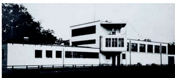
Рис. 5. Клуб рабочих, Ленинградская обл., 1923 г. Арх. Л. Хидекель [5]

Все практикующие скульпторы первых десятилетий БССР были либо самоучками, либо выпускниками Императорской Академии художеств. Поэтому для создания ответственных работ приглашались специалисты из Москвы и Ленинграда. Так, М. Манизер получил звание Заслуженного деятеля искусств БССР (1933 г.) за памятник В. Ленину у Дома правительства, отражающий важные вехи белорусской истории: на центральном барельефе изображены партизанская борьба, Красная Армия, ГПУ и освобождение Беларуси от белополяков, на боковых сторонах показаны промышленный рост и сельское хозяйство БССР (рис. 6).