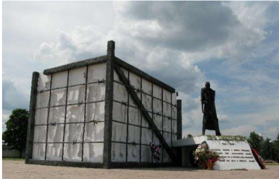
Рис. 8. Мемориальный комплекс жертвам фашизма «Куб мужества и скорби».

2020 г., скульпт. И. Артимович, арх. М. Левашова), Мемориальный комплекс жертвам фашизма «Куб мужества и скорби» (г. Бобруйск, 2014 г., арх. Л. Левин, Г. Левина, А. Копылов, скульпт. А. Шаппо) (рис. 8).