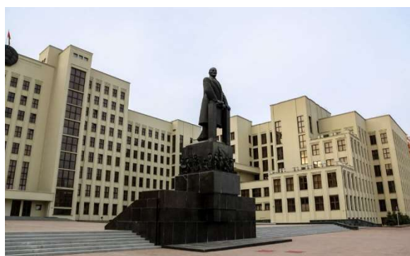
Рис. 6. Памятник В. Ленину, Минск, 1933 г., скульпт. М. Манизер

Новое поколение белорусских мастеров обучалось в Витебском художественном техникуме, в художественных ВУЗах Москвы и Ленинграда. При этом вся сфера изобразительного искусства БССР была состав-