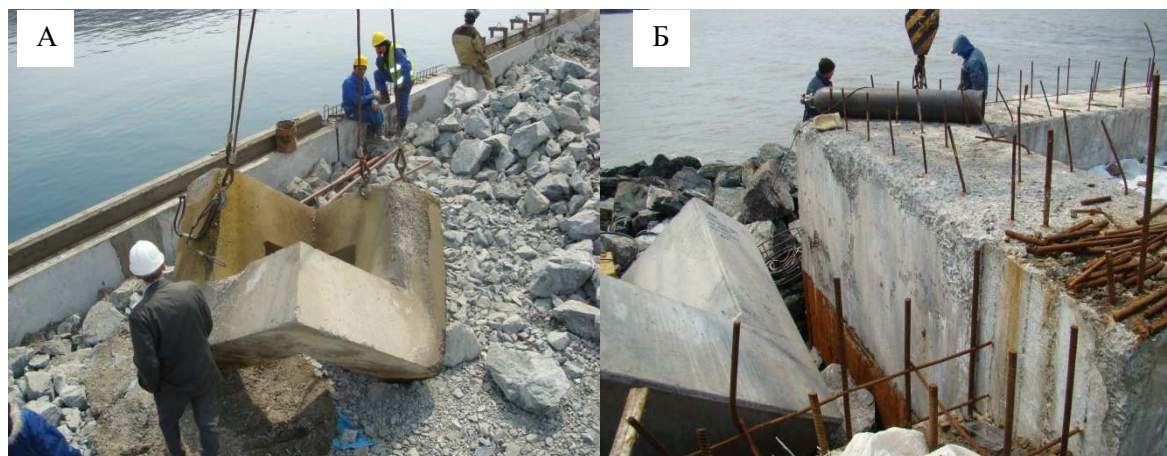
Рисунок 2. – Характерный вид разрушения бетона в зоне переменного уровня после первого зимнего сезона: А – берегоукрепление из гексабитов в порту Козьмино (г. Находка, Приморский край, 2008); Б – причальная стенка в порту Углегорск (о. Сахалин, 2010).

платационных свойств отказ можно классифицировать как по критичности, так и по причинам его возникновения. В рассмотренных случаях отказ относится производственному отказу, поскольку произошел вследствие производственных недоработок. Явный внезапный отказ обусловлен, с одной стороны, характером внешних воздействий- обмерзанием конструкций морским льдом, с другой- не обеспечены условия выдерживания бетона при положительных температурах после пропаривания. Есть все основания считать, что процесс накопления структурных дефектов в бетоне при обмерзании морским льдом происходит более интенсивно, чем при воздействии циклов замораживания и оттаивания от обычных отливно-приливных явлений в зоне переменного уровня вертикальных стенок морских причальных сооружений.