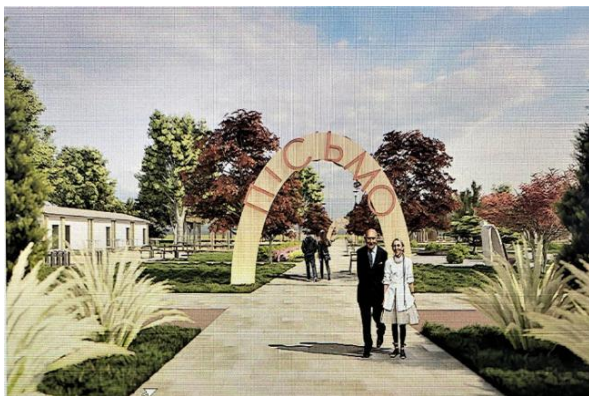
Рис. 8. Разработка малых архитектурных форм: а - МАФ с использованием букв алфавита, б - амфитеатр-клавиатура, студенты Зыблева В.В., Лось С.В.