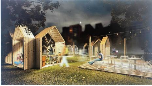
Рис. 6. Многофункциональные павильоны из дерева