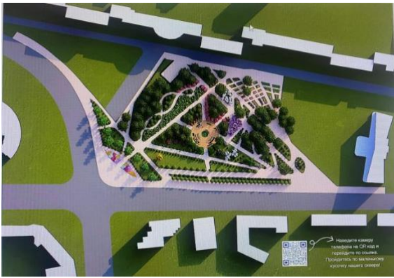
Рис. 1. Генеральный план сквера «Контакт», студенты Бурак Б.А., Запольская П.Д.