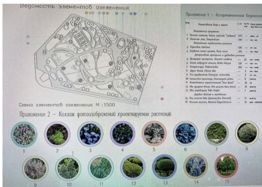
Рис. 11. Предложения по озеленению сквера

Визуальным акцентом сквера, перекликающимся с высотной доминантой центра «Парус», является детская площадка с игровым комплексом в виде стилизованного парусника с мачтами. Особое внимание в проекте уделено подбору ассортимента посадочного материала в виде злаков и многолетников, имеющих холодную, голубоватую гамму, что также поддерживает общую концепцию сквера (рис. 11).