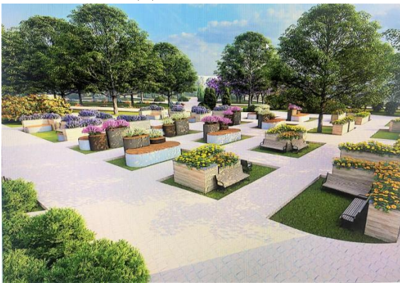
Рис. 3. Площадка с сенсорными клумбами и информационными щитами, написанными шрифтом Брайля