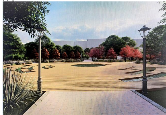
Рис. 4. Главное общественное пространство сквера – водный лабиринт

Архитектурная концепция сквера «Маладосць» (диплом 2 степени, авторы студенты Ракуть Р.Д., Горбачева А.Н.) сочетает современные тенденции в благоустройстве городских скверов, традиции белорусской культуры и пожелания местного сообщества. Основным планировочным элементом становится аллея из модульных элементов, повторяющих в плане белорусские орнаменты «Маладосць» и «Агонь».