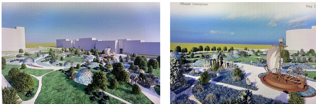
а б Рис. 10. Концепция сквера «Под парусом», студентка Василевич В.В.: а общий вид сквера, б – детская площадка «Парус»

многофункциональным общественным центром «Парус». Геопластика в виде пологих холмов, расположенных вдоль ул. Кальварийской, служит защитой сквера от загруженной транспортом городской магистрали и органично поддерживает основную идею в виде «бегущей волны» (рис.10).