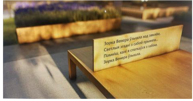
Рис. 7. Дизайн скамей с перфорацией произведений белорусских поэтов