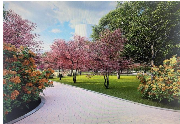
Рис. 2. Прогулочная аллея с посадкой красивоцветущих кустарников и плодовых деревьев