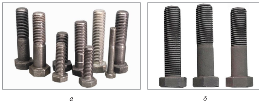
Рис. 1. Внешний вид образцов до цинкования (а) и после проведения термодиффузионного цинкования в порошковой смеси на основе гартцинка (б)

толщина слоя после 1 ч обработки составила около 20 мкм. Такое снижение скорости насыщения связано с меньшей диффузионной активностью смеси. По нашему мнению, частично компенсировать этот недостаток можно повышением температуры обработки, что было отмечено выше.