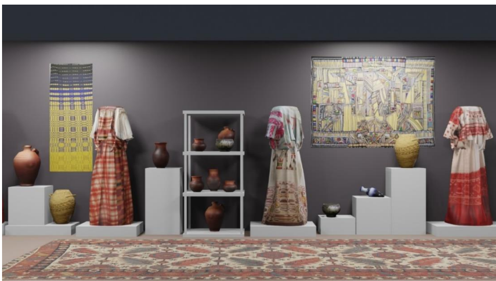
Рисунок 1 – Фрагмент прототипа виртуального музея