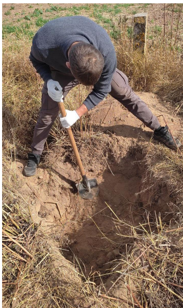
Рис. 1. Поиск геодезических пунктов