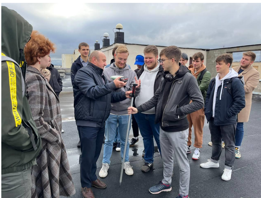
Рис. 3. Мастер-класс по поиску геодезических пунктов

Кроме этого, для всех участников конкурса был проведён мастер-класс по использованию высокоточного геодезического оборудования (рис.3) и прочитана лекция о том, почему так важно сохранять пункты Государственной геодезической сети.