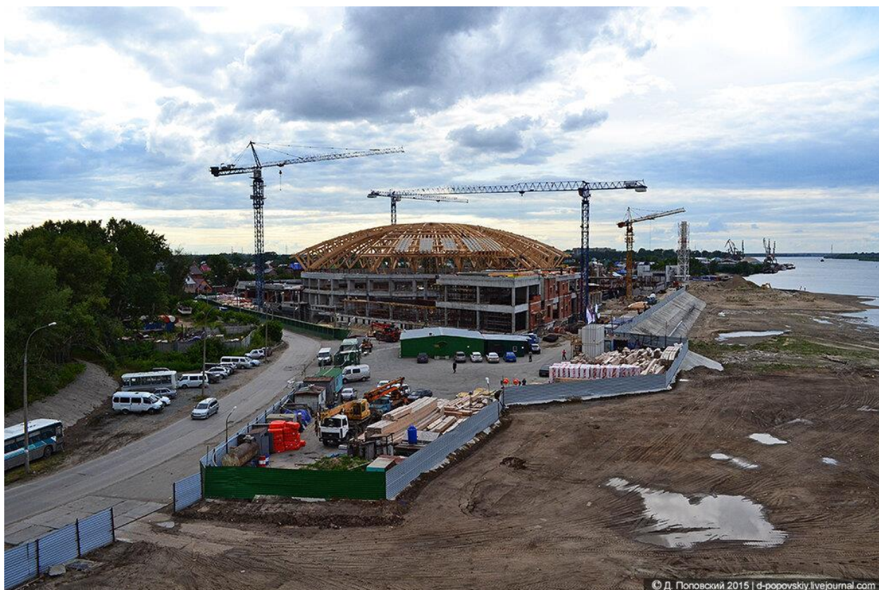
Рисунок 1 – Начало покрытия

Первый в Новосибирске аквапарк. Сразу было принято решение накрыть аквапарк куполом (сделать его закрытым), часть конструкции уже установлена на объекте и это хорошо показано на рисунке 1. Строительство данного аквапарка началось в 2015-ом году.