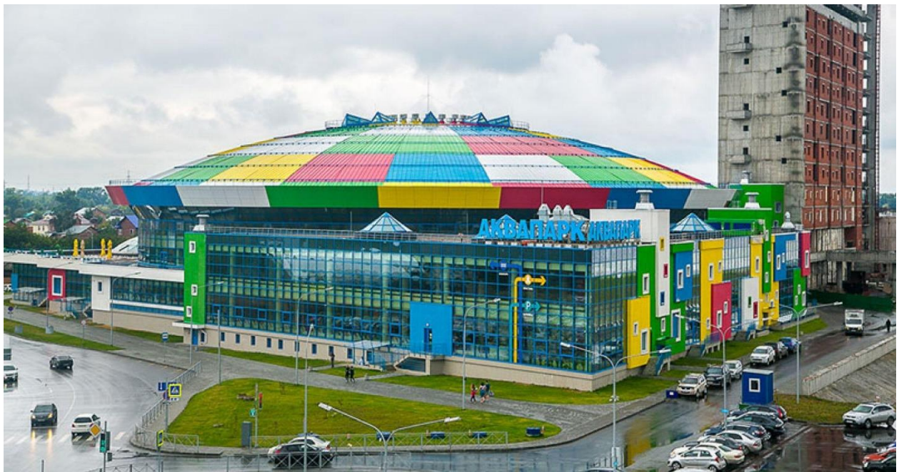
Рисунок 3 – Завершение строительства

После открытия аквапарка начали строительство рядом гостиницы и многоуровневой парковки, также будет облагорожена прибрежная зона.