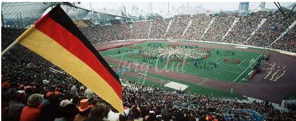
Рисунок 2 – Стадион в Мюнхене во время Олимпийских игр

Летние игры, которые, наконец, состоялись в тот же год открытия, которого так ждал Мюнхен, были омрачены нападением палестинских террористов. Это место, которое должно было олицетворять свободу, мир и открытость миру, стало ареной теракта, в результате которого были убиты одиннадцать израильских спортсменов и немецкий полицейский.