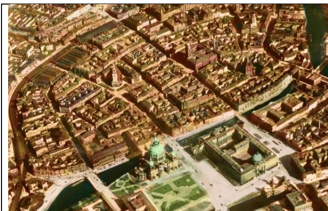
Рис. 9 - Александерплац и Маркс – Энгельс форум довоенный вид

Идея создания в историческом центре Берлина ещё одной площади для демонстраций трудящихся возникла еще в начале 50-х годов. Площадь было решено расположить на месте разрушенного в годы войны района жилых и коммерческих зданий, снесенных после 1945 года. Так же важным фактором явилось ее расположение на пересечении двух главных в структуре города композиционных осей: Унтер-ден-Линден и Сталин-алее. Площадь представляет собой открытое по периметру зеленое пространство, в центре которого скульптурная группа Маркса и Энгельса. Архитектурной и смысловой доминантой стал построенный в 1976 году на месте бывшего дворца Кайзера – Дворец Республики, но снесённый после падения Берлинской стены (рис. 9, 10).