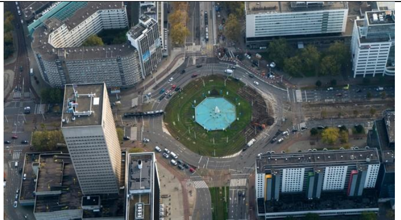
Рис. 6 – Современный вид Хофплеин

Поскольку площадь в центре кольцевой развязки недоступна из-за оживленной дороги и трамвайных путей, стоял вопрос о создании доминанты в центре. Были предложения установить колонну в честь В. Черчилля, позже 25-метровую кинетическую скульптуру Джорджа Рики. В 1966 году принято решение сделать Фонтан в восьмиугольной чаше диаметром 31 м (рис. 6). Но по-прежнему актуальным оставался вопрос застройки площади проходящей вдоль улицы Уин между Хофплей и железнодорожной станцией (позже вокзалом), данная часть города получила название центрального округа. Был снова объявлен конкурс в 1977 году, победило предложение от компании Urban Development проект Weena-Tivoli с центром развлечений в парке (рис. 8), вдохновленным Тиволи в Копенгагене.