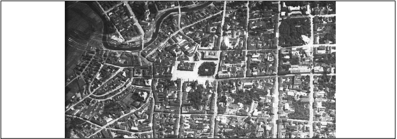
Рис. 1- Аэрофотосъемка центральной части Минска, 1917 г.

Соборная площадь сохраняла своё главенствующее положение, даже после 1919 года, когда Минск становится столицей БССР. Положение изменяется в 1934 году со строительством Дома правительства и формированием площади Ленина – началом Ленинской улицы. После Великой Отечественной войны почти полностью разрушенные постройки Верхнего города не восстанавливали, а разбирали и перестраивали. Соборная площадь утратила довоенный архитектурный образ, а к началу 50-х годов XX века и значение главной площади.