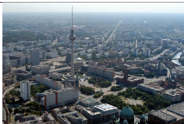
Рис. 10 - Александерплац и Маркс – Энгельс форум современный вид