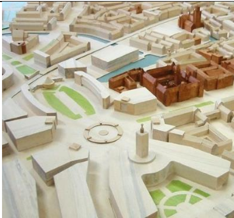
Рис. 5 – макет проекта Хофплеин от Виттевена