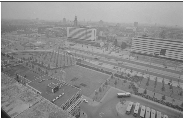
Рис. 7 - Парк на Уине был завершен в 1969 г.

В 1979 году городской совет решил разместить места отдыха в другом месте и застроить Уину жильем и местами отдыха по модели бульвара [3]. В итоге на Уине разместился большой парк. Улица стала представлять огромное пространство с широкой магистралью и главной развязкой в городе, не спешившей утопать в зелени (рис.7).