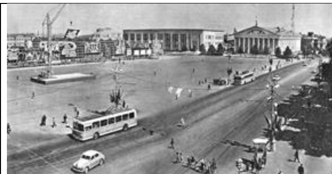
Рис. 2 - Центральной площади 1950-е годы