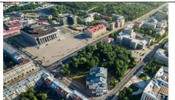
Рис. 3 - Современный вид Октябрьской площади