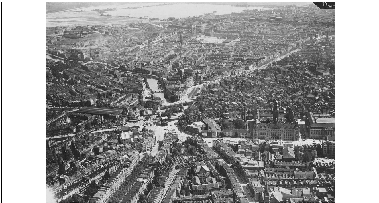
Рис. 4 – Хофплейн в начале XX века

В 1985 году на Центральной (теперь уже Октябрьской) началось строительство Дворца культуры БССР (Дворца Республики), которое длилось 17 лет. Сегодня площадь по-прежнему представляет из себя большое открытое пространство, используемое лишь для проведения праздников и массовых мероприятий (рис. 3).