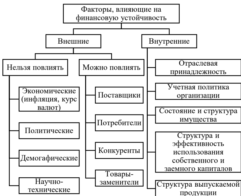
Рисунок 1 – Факторы, влияющие на финансовую устойчивость

Финансовая устойчивость является сложным понятием (рисунок 2). Ее определение шире понятий «платежеспособность» и «кредитоспособность», так как включает в себя оценку разных сторон деятельности.