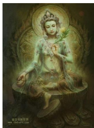
Рис. 2. Тара (худ. Цзэн Хао)