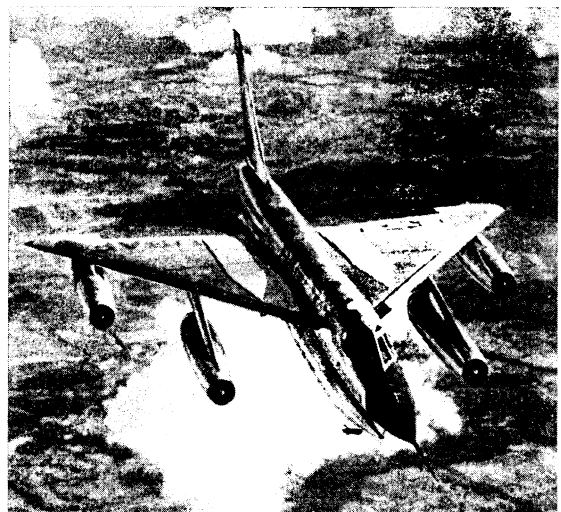
Б-58 в полете

Размещение двигателей под крылом и подвеска контейнеров под фюзеляжем потребовали применения высоких стоек шасси. Системы уборки-выпуска этих шасси были очень сложными по кинематике, так как они «не укладывались» в фюзеляж. Конструкторам пришлось делать на стойках своеобразные «колени» и убирать их в поджатом состоянии.