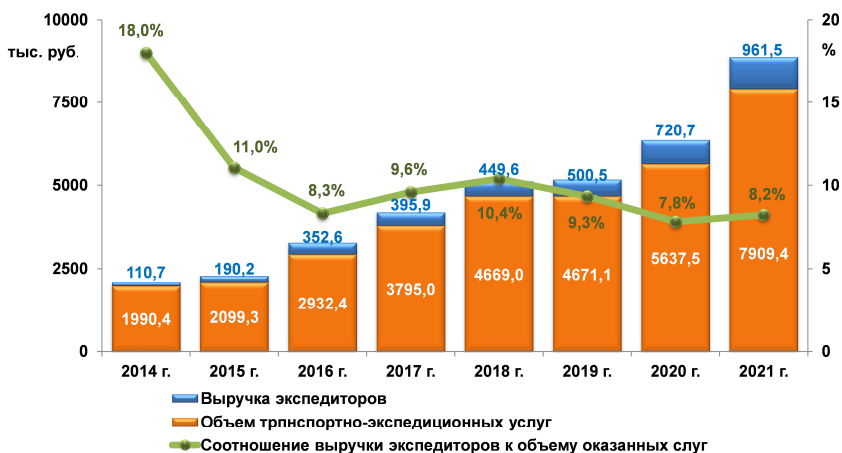
Рисунок 3 – Динамика объемов транспортно-экспедиционных услуг и доля выручки экспедитора

(в 2020 году – 1,77 млрд руб.), а с нерезидентами – 5,05 млрд руб. (в 2020 году – 3,86 млрд руб.). Увеличилось количество контрактных отношений с нерезидентами Республики Беларусь.