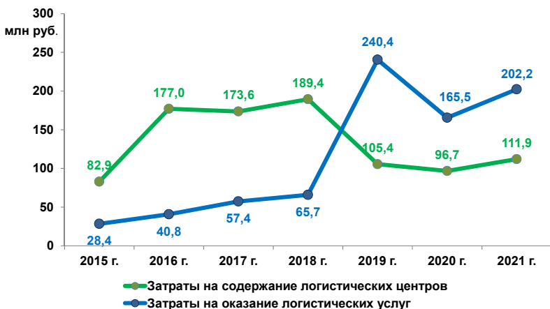
Рисунок 5 – Динамика затрат на содержание логистических центров и затрат связанных с оказанием логистических услуг

Для совершенствования условий деятельности субъектов хозяйствования, осуществляющих деятельность в Республике Беларусь, Министерством транспорта и коммуникаций Республики Беларусь разработан и реализуется План мер по созданию условий для ускоренного развития сферы логистических услуг в Республике Беларусь (утвержден заместителем Премьер-Министра Республики Беларусь 02.12.2021). План состоит из следующих разделов: Совершенствование механизмов регулирования логистики и управления цепями поставок, Совершенствование таможенного администрирования перемещения транспортных средств и грузов, Развитие международного сотрудничества, проведение исследований международных и национальных логистических систем, и грузопотоков, Повышение эффективности функционирования логистических центров.