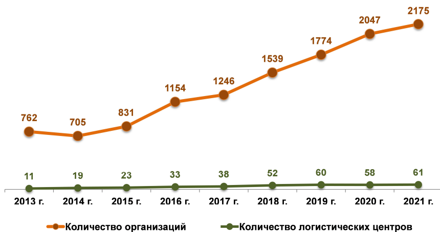
Рисунок 1 – Динамика изменения количества субъектов хозяйствования, оказывавших транспортно-экспедиционные и логистические услуги, и количества логистических центров

«Транстехника» на основании статистической информации собираемой с субъектов хозяйствования по форме 1-логистика (Минтранс) «О логистической, транспортно-экспедиционной деятельности». В 2021 году 2175 респондентов отчитались о результатах своей деятельности. В тоже время, 2976 субъектов хозяйствования, зарегистрированных в Едином государственном регистре юридических лиц и индивидуальных предпринимателей Республики Беларусь, заявили, что планируют заниматься логистической и транспортно-экспедиционной деятельностью, но реально не приступили к ней. Динамика изменения количества субъектов хозяйствования, оказывавших транспортно-экспедиционные и логистические услуги, и количества логистических центров приведена на рисунке 1.